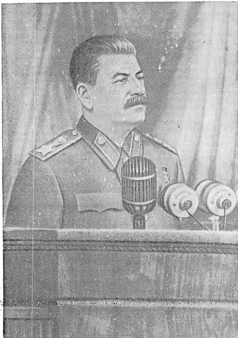
Выступление товарища И. В. Сталина на предвыборном собрании избирателей Сталинского избирательного округа гор. Москвы 9 февраля 1946 года в Большом театре.

№ 10 (451) | 21 февраля 1946 года | Цена 15 коп.