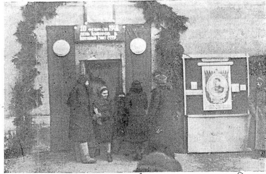
У входа в избирательный участок.