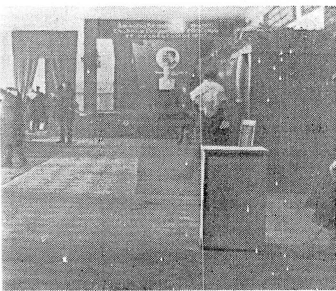
Избирательного участка Фото Р. КАРАСЕВА.