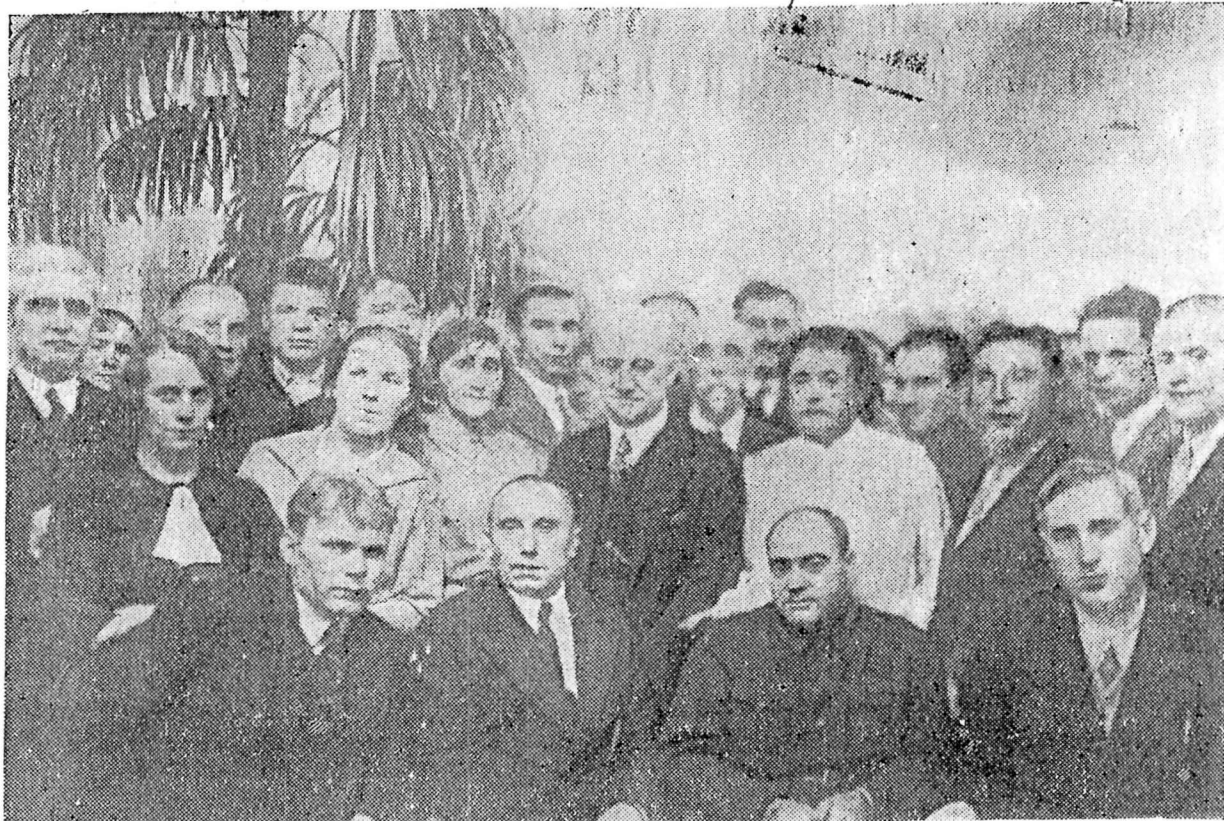
Делегаты съезда на товарищеской встрече.