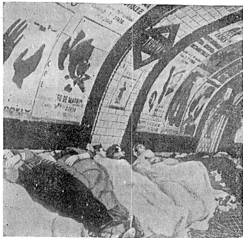
При нападении самолетов мятежники из население Мадрида спасается в метро. НА СНИМКЕ: ночлег в тоннеле метро.

Припев. Бездушный гнет, тупой, холодный, Готов погибнуть наконец. Нам будет счастьем труд свободный, И братство даст ему венец. (2 раза) Припев. Вперед, друзья! Идем все вместе, Рука с рукой, и мысль одна. Кто скажет буре: «Стой на месте!» Чья власть на свете так сидна? (2 раза). Припев. Долой тиранов! Прочь оковы! Не нужно старых рабских пут! Мы путь земле укажем новый: Владыкой мира будет труд. (2 раза). Припев.