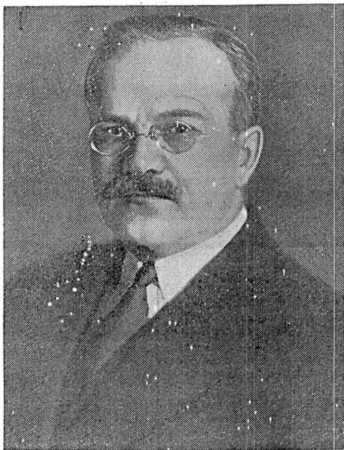
Вячеслав Михайлович МОЛОТОВ

кандидат в депутаты Верховного Совета СССР от Молотовского избирательного округа