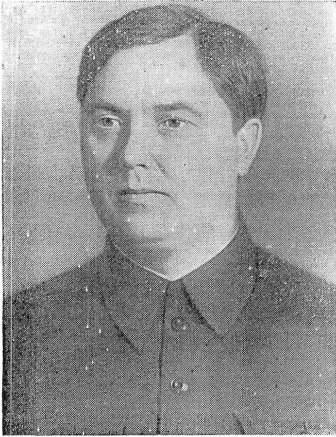
Георгий Максимиланович МАЛЕНКОВ кандидат в депутаты Верховного Совета СССР от Ленинградского избирательного округа

...тия Ленина—Сталина яви- направляющей силой совет- народа как в период мир- строительства, так и в годы л. Наш народ неуклонно по пути, по которому на- яли его коммунистическая я, великий вождь партии и а товарищ Сталин. В дни ственной войны партия во с товарищем Сталиным вдохновителем и организа- всенародной борьбы против истских захватчиков. За вре- ойны коммунистическая пар- еще более сроднилась с на- и, еще теснее связалась с кими массами трудящихся и беззаветным служением те партия большевиков за- пла любовь и доверие совет- народа. Партия коммуни- гордится и дорожит дове- какое оказал и оказывае- аш народ. Партия Ленина— ина и впредь рассчитывае- оверие советского народа. Из обращения ЦК ВКП(б).