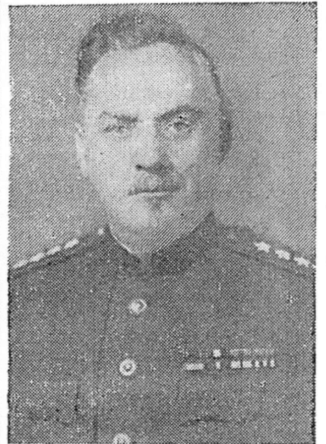
Николай Александрович БУЛГАНИН

кандидат в депутаты Совета Национальностей Верховного Совета СССР от Московского городского избирательного округа