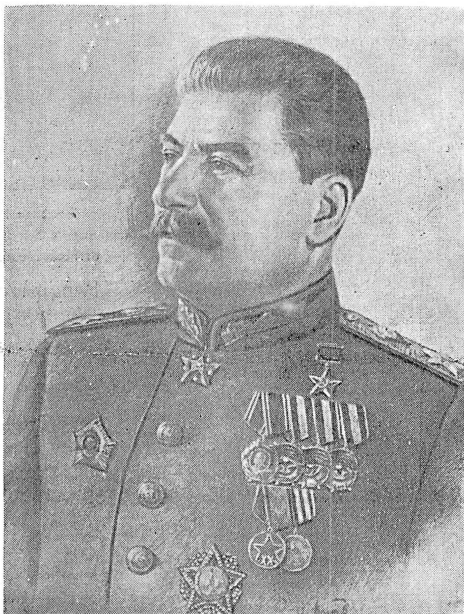
Иосиф Виссарионович СТАЛИН кандидат в депутаты Верховного Совета СССР от Сталинского избирательного округа