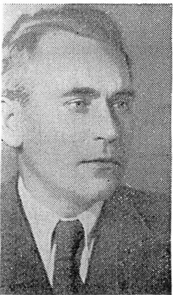
Дмитрий Николаевич ЧЕЧУЛИН кандидат в депутаты Верховного Совета СССР от Московского избирательного округа