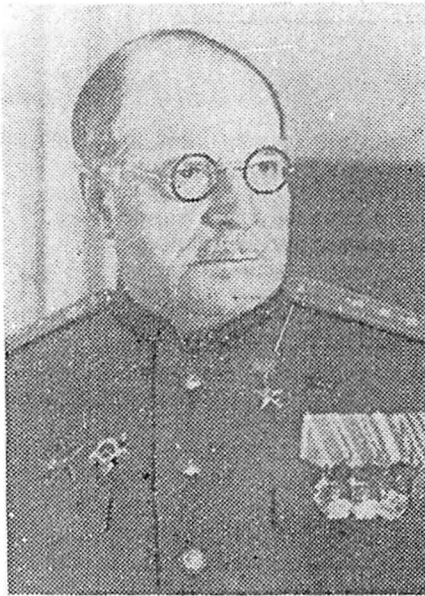
Николай Нилович БУРДЕНКО

кандидат в депутаты Верховного Совета СССР от Калининского избирательного округа