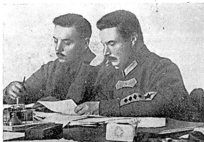
Товарищи М. В. Фрунзе и К. Е. Ворошилов (1925 г.).