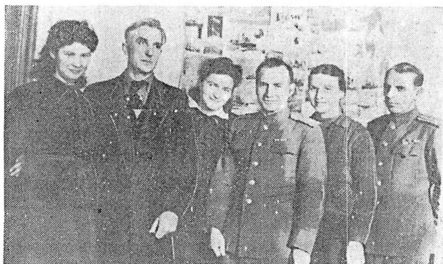
На снимке: бригады агитаторов 25-го избирательного участка Ленин- ского избирательного округа.