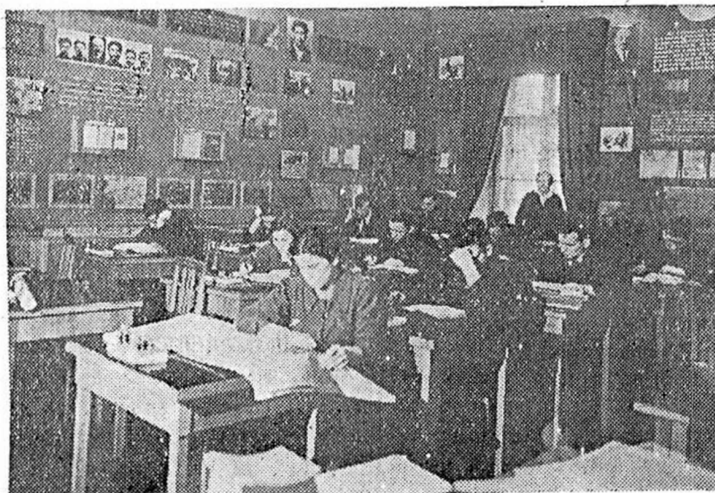
Перед экзаменом в кабинете марксизма-ленинизма.

Такой агитатор смело и уверенно ответит на самые острые вопросы, не будет смазывать любой из них. Но для этого требуется, чтобы агитатор неотрывно читал газету «Правда», следил за журналами «Большевик», «Коммунистический интернационал», «Партийное строительство», «Спутник агитатора». Это минимум.