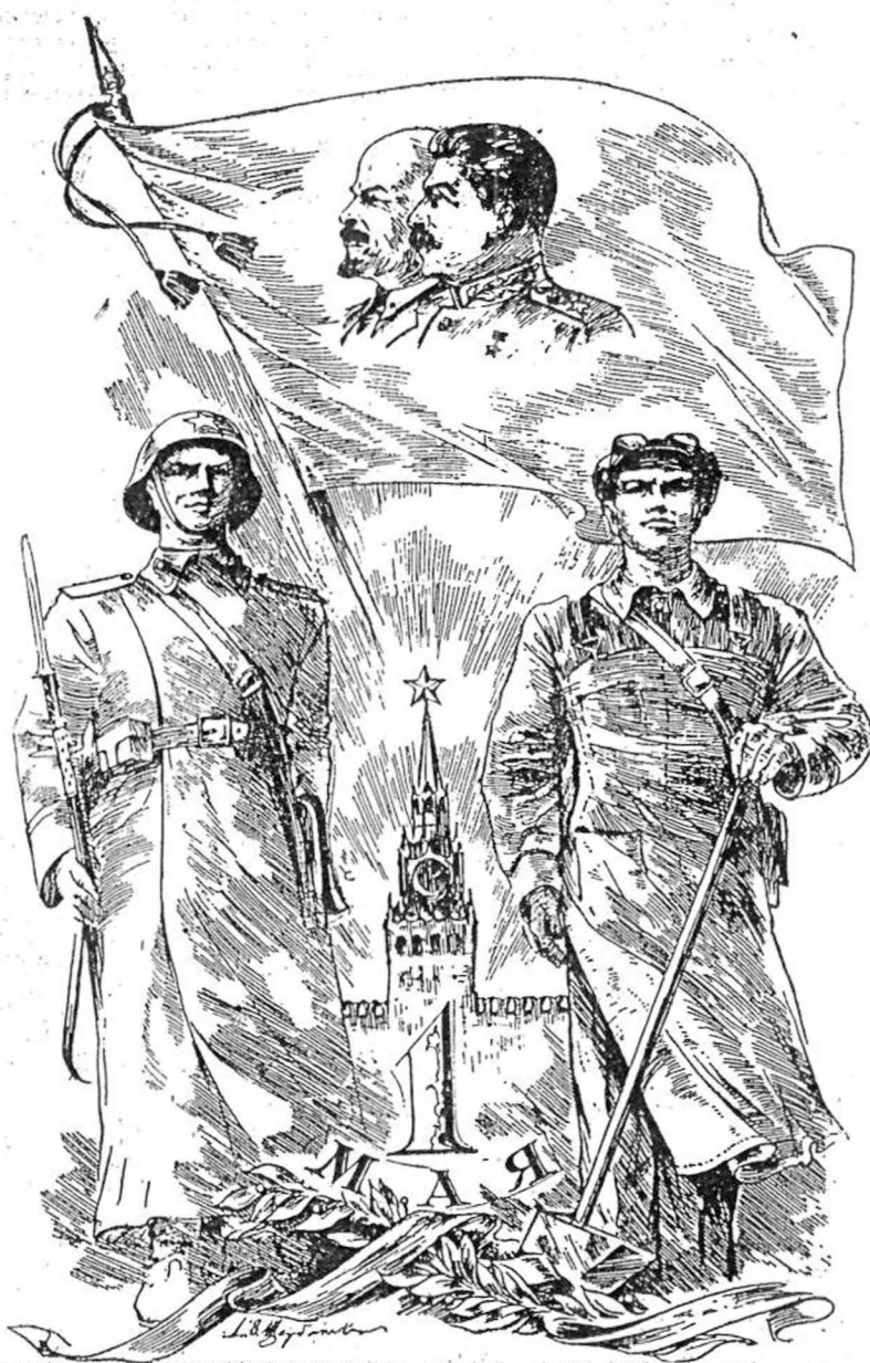
Наша сила — в единении фронта и тыла